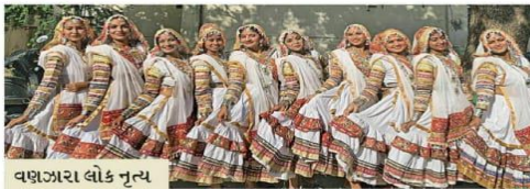
વણઝારા લોક નૃત્ય વણઝારા સમુદાયમાં ગરબાના લોકગીત પર વણઝારા લોકનૃત્ય રજૂ કર્યો હતો.

સિટી ઝોન યુથ ફેસ્ટિવલના અંતિમ દિવસે જનજાગૃતિના મેસેજ સાથે સ્કીટ અને માઈમ રજૂ કરાયા. જ્યારે ફોક ડાન્સમાં ગુજરાતના જાણીતા ગરબાના વિવિધ પ્રકારો, રાજસ્થાની, કેરાલાના લોકનૃત્યોની પ્રસ્તુતિ કરવામાં આવી હતી. દરેક ઈવેન્ટમાં ભાગ લેનાર સ્ટુડન્ટ્સમાં ગર્લ્સની સંખ્યા વધુ હતી. ૧૫ ઈવેન્ટમાં લગભગ ૭૦૦ સ્ટુડન્ટ્સે ભાગ લીધો હતો.