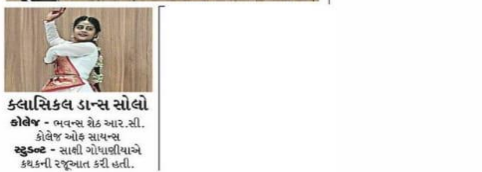
કલાસિકલ ડાન્સ સોલો કોલેજ - ભવન્સ રોક આર.સી. કોલેજ ઓફ સાયન્સ સુલકા સુલકા - સાહી ગોપાલીયાએ કલ્પની રજૂઆત કરી હતી.

વિવિધ કોલેજના સ્ટુડન્ટ્સ વચ્ચે જનરલ મોલેજ તથા અલગ અલગ મુદ્દાઓ પર કિનટા કોમ્પિટિશન યોજાઈ હતી.