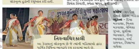
તિરુવાથિરકાલી આ કેરાલાનું લોકનૃત્ય છે જે ત્યાંની મહિલાઓ દ્વારા પાર્થિવ વિધિના ભાગરૂપે રજૂ કરવામાં આવે છે.

કોલેજ - પુ.સી. પટેલ આર્ટ્સ એન્ડ કોમર્સ કોલેજ સુલકા ફિરકા - સહુલ, સહીક, મહેક, સનોવર, જ્ઞાના, સુજલ ફિરકા - વિમલ પાટીલ... આ સ્કીટમાં ભારતના યુવા વર્ગની વાત કરી છે, જે આજે ડિજિટલ ટેકનોલોજી સાથે દરેક સમસ્યાનું નિરાકરણ લાવી રહ્યો છે. આ સાથે ભારતની આઝાદીના વર્યાયઓની વાથા સાથે ડિજિટલ યુગના યુવાનોની કહાની રજૂ કરી હતી.